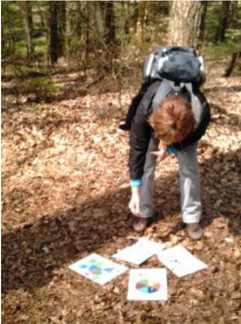
Afbeelding 4: testen met orgone