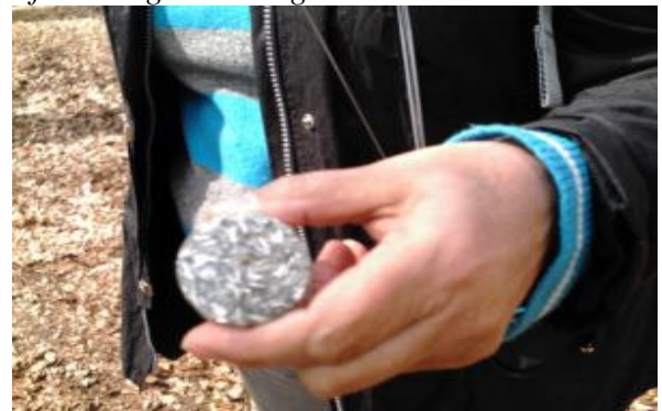
Afbeelding 1: de Orgone